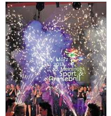
LED, Laserlicht und Pyro-Effekte – für die perfekte Inszenierung wurden in der Halle keine Mühen gescheut.