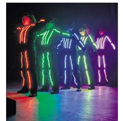
Die bei der ABS electronic GmbH entwickelten Licht-Anzüge ließen die Modern-Style-Girls noch mehr leuchten.