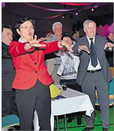
Bei der Laola-Welle durch den ganzen Saal machte auch Sozialministerin Heike Taubert eine gute Figur.