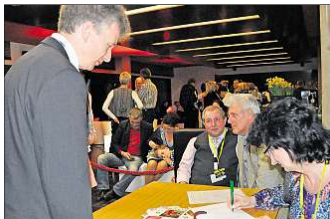
Veranstaltet wurde der Computerwettkampf von FW Meiningener Tageblatt. Die Ergebnisse sind am Stand der Meiningener Mediengesellschaft genau notiert und daraus am Ende die Preisträger ermittelt worden.