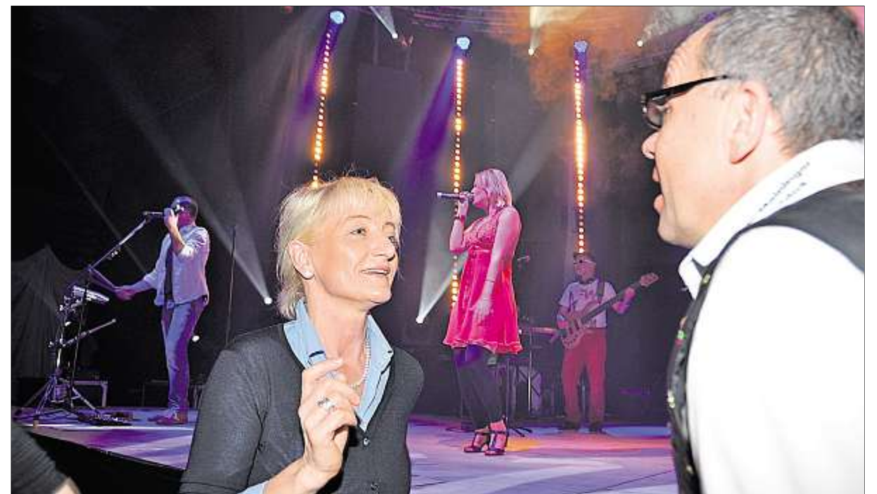
Die JAM-Liveband sorgte bis in die frühen Morgenstunden für Hochstimmung im Saal und eine stets gut gefüllte Tanzfläche. Sportliche Betätigung war so auch beim Feiern durchgängig möglich.