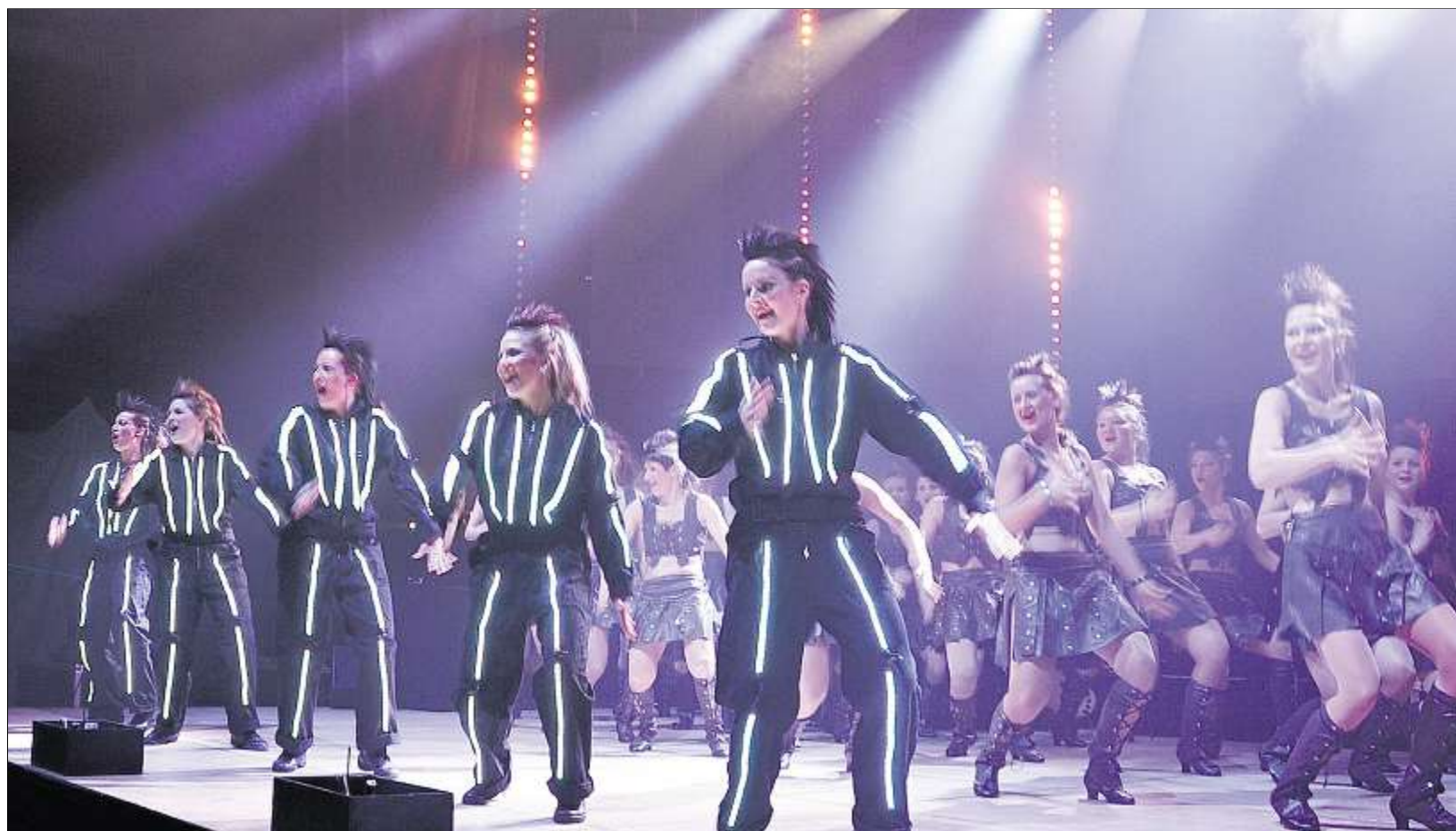
Die Modern-Style-Dancers ließen es am Samstag richtig krachen und begeisterten mit ihrem Können – auch beim Premierentanz mit den Leuchtanzügen.

An Professionalität mangelte es von der ersten Minute an nicht. So sorgten perfekt inszenierte Bilder im Saal und auf der Bühne für den passenden Rahmen. Künstler, wie der