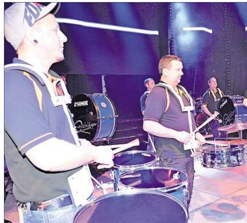
Die Querschläger aus Christes sorgten mit ihrem Trommelwirbel für ein akustisch Schlaglicht im Saal. So waren die Gäste fit für weitere Ehrungen.