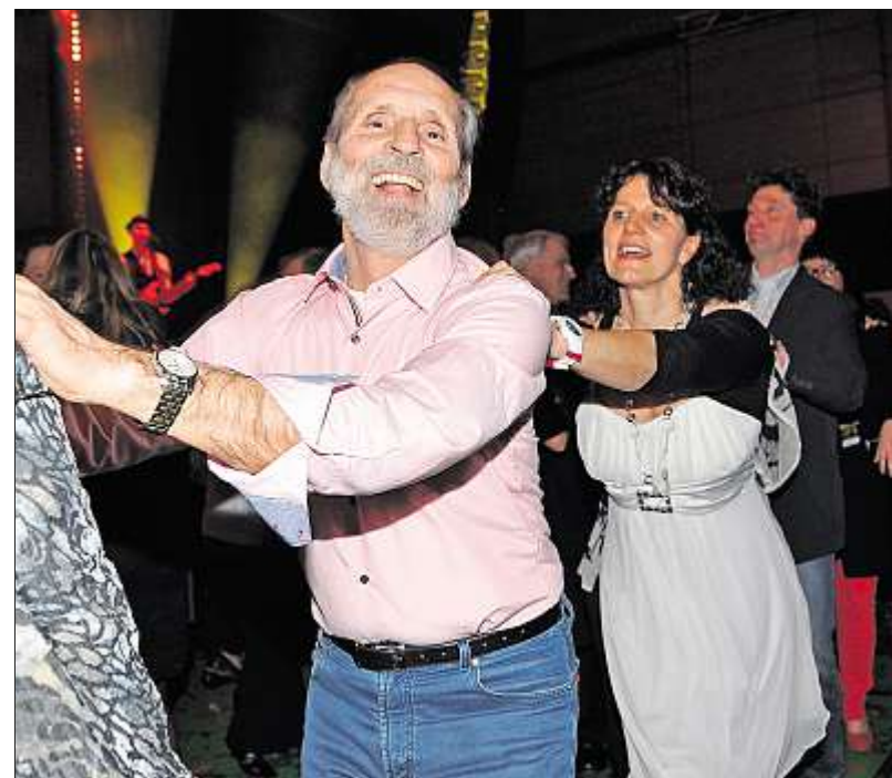
Selbst für Polonaisen brauchte es keine energischen Aufforderungen. Das Publikum war von der ersten Minute an in Hochstimmung und feierte ausgelassen.