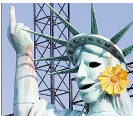
Den Stinkefinger zeigen kann zwischen 600 und 4000 Euro kosten.

Die Duma könnte sich ja am deutschen Vorbild orientieren. Flüche und Schimpfwörter wird der Leser von Tageszeitungen