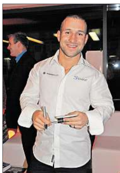
Bahnradfahrer Robert Förstemann schrieb fleißig Autogramme.