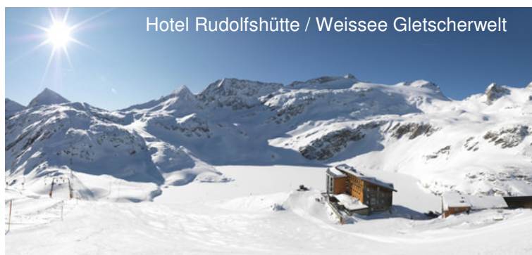
Hotel Rudolfshütte / Weisse Gletscherwelt

Ski Alpin; Variantenski; Touren-, Schneeschuh gehen; Indoorklettern